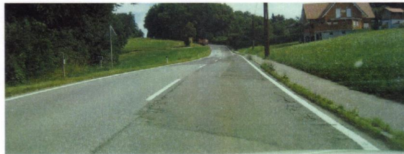
Über ein Kilometer der B65 wird in Kainbach bis Dezember saniert