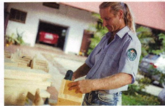
Der Naturliebhaber bei der Arbeit: Vogelhäuschen und Nistkästen erstellt der Unterpremsstätener in Handarbeit.

im Wald, kennen keine Bäume oder Tiere mehr“, weiß der 44-Jährige.